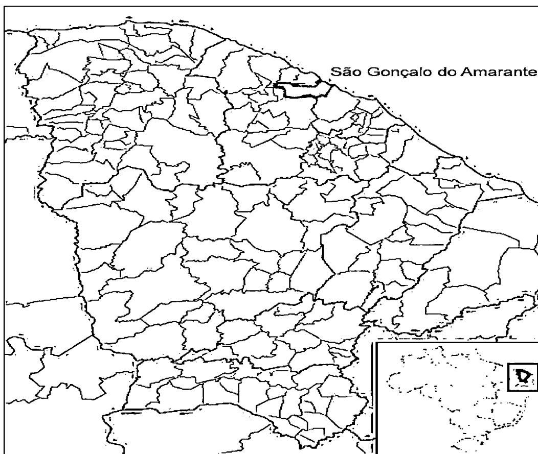
Figura 1 – Contexto Territorial: São Gonçalo do Amarante

O Município ocupa uma área de 834.448 km 2 , equivalente a 0,56% do território cearense. Por estar situado no litoral, apresenta altitude média de 15,9 metros em relação ao nível do mar.